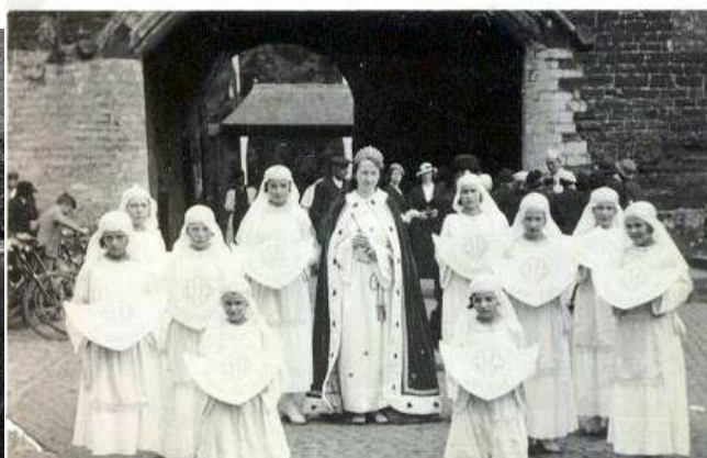
De groep van de Kruistochters aan de ingang van het domein van Van Autgaerden (Evrard toen)

Op deze plakkaat staat te lezen: Voetgangers en wielrijders/ Piétons et Cyclistes (houten bord, dat de toegang verbiedt voor auto's in de K. Albertlaan)