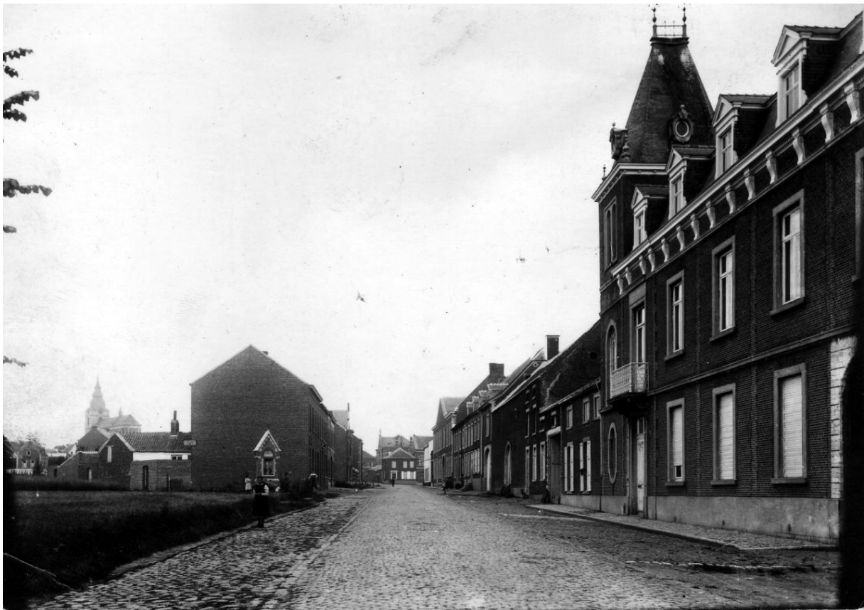
E. Ourystraat met 'Vijvershof van Van Autgaerden – Adams en het kapelletje van O.-L.-Vrouw Ver. Uitg. M. DODION, Lelielaan, 34, 3191 Hever

Anno L nr. 197 4/2014 driemaandelijks december, januari, februari 2014/2015 Afgiftekantoor 3190 Boortmeerbeek