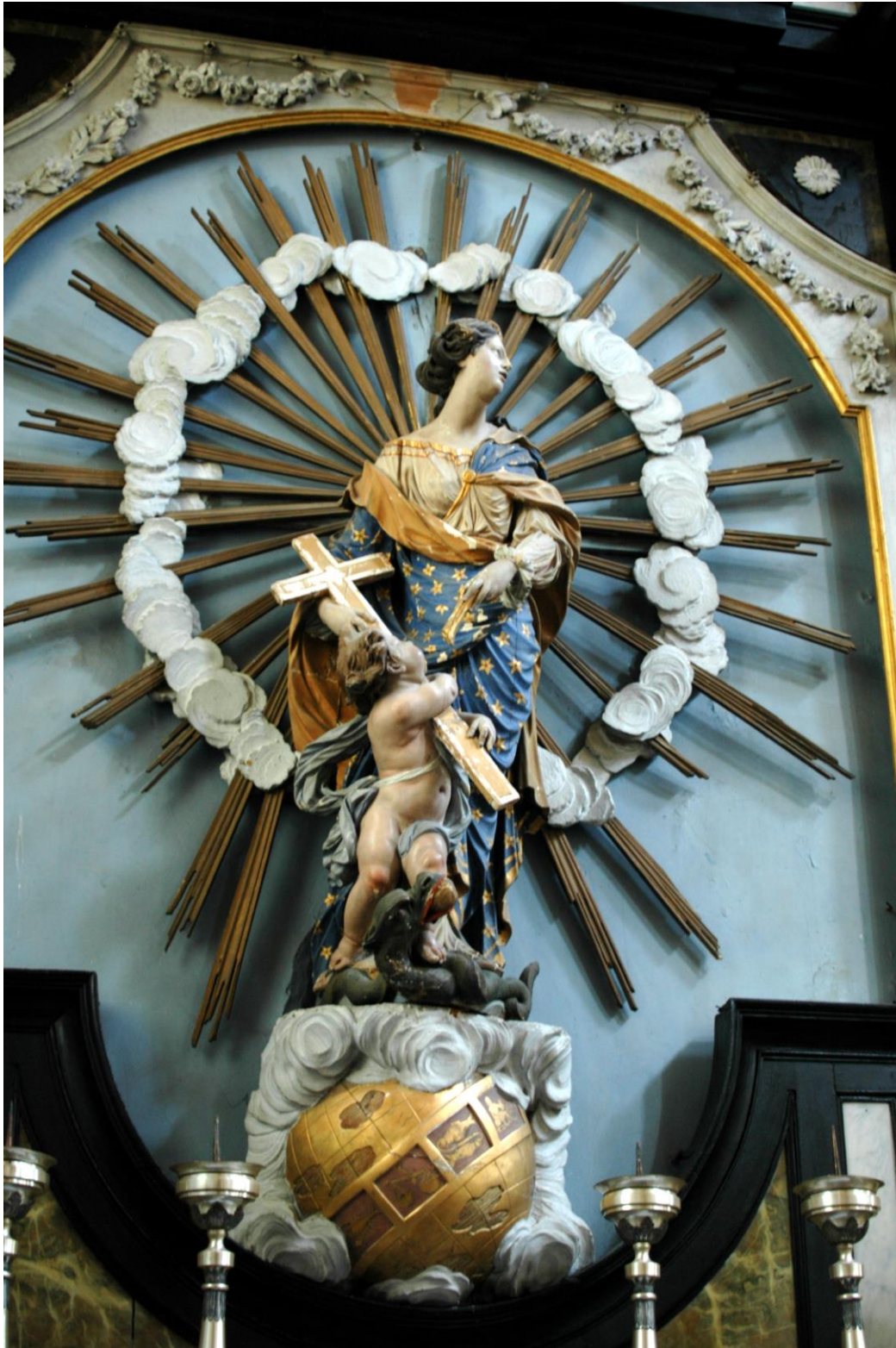
O.-L.-Vrouw Onbevleete Ontvangenis met Kind dat kruis draagt, vertrapt de Slang, staat op wereldbol met dierenriem, O.L. Vrouwaltaar in de S. Gorgoniuskerk (begin 18de eeuw ?, gepolychromeerd hout, ca. 150 cm B 80550'44)